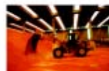
TERMINAIS GRANEIS SÓLIDOS