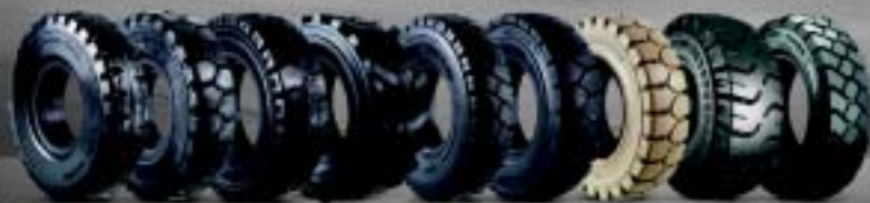
Masterflex, Bigfoot, Dura, SR-800 e 900, T-800, T-900, Não mancharno, Elite XP, TR-900

TR-900, um pneu radial de performance e durabilidade realmente impressionantes.