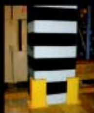
Protetores pilonatas estruturais