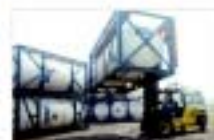
LOCAÇÃO DE ISOTANKS e TANQUES RODOVIÁRIOS