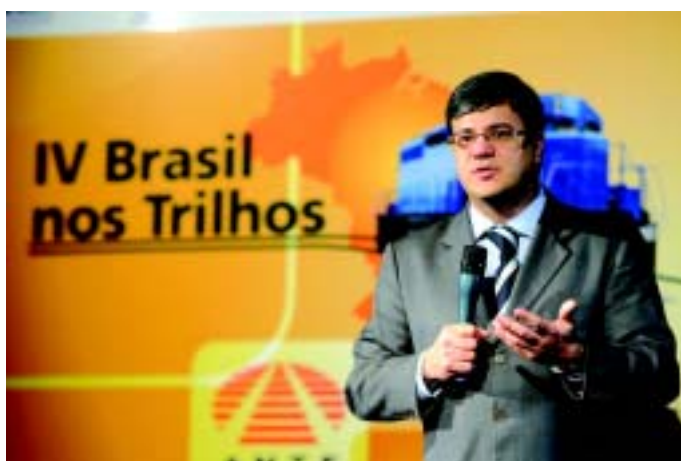
Vilaça e a sensação de dever cumprido: “salvamos o patrimônio da malha ferroviária”

Além de trabalhar pela continuidade do sucesso nas