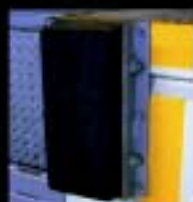
Protetor pátios niveladoras