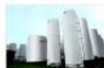
TERMINAIS GRANEIS LÍQUIDO