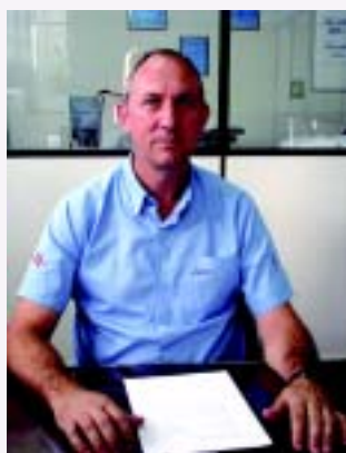
Schürhoff, da FTC: a empresa precisará ampliar sua extensão, integrando-se à malha nacional