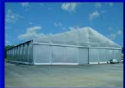
Vãos livres de 10 a 50m