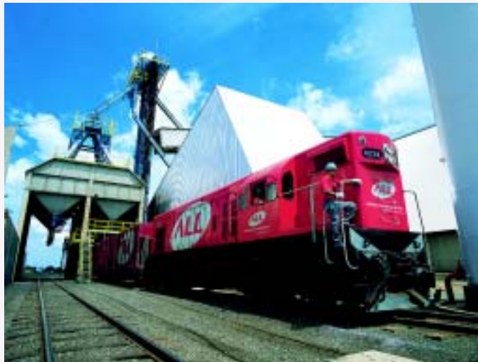
Nos próximos cinco anos, a ALL pretende dobrar o tamanho do negócio

Além disso, outro grande projeto é o acordo com a Rumo