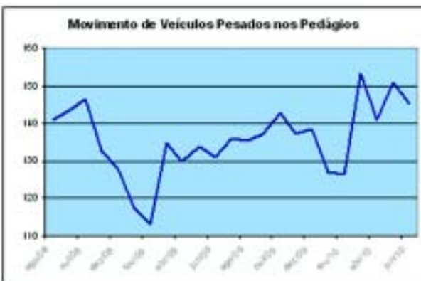
De janeiro a setembro de 2010, o movimento de caminhões nas praças de pedágios cresceu 11,9%