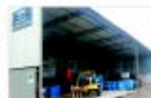
GERENCIAMENTO DE RESÍDUOS