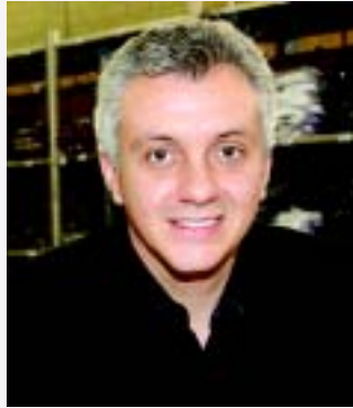
Flório, da Log Fashion: a reposição de produtos no momento correto está entre as maiores necessidades logísticas do setor

Para eles, é preciso uma rede logística confiável que esteja presente nos novos mercados, traga simplificação ao negócio e