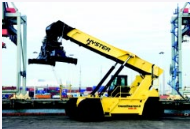
Os reach stackers são os equipamentos mais utilizados nos portos