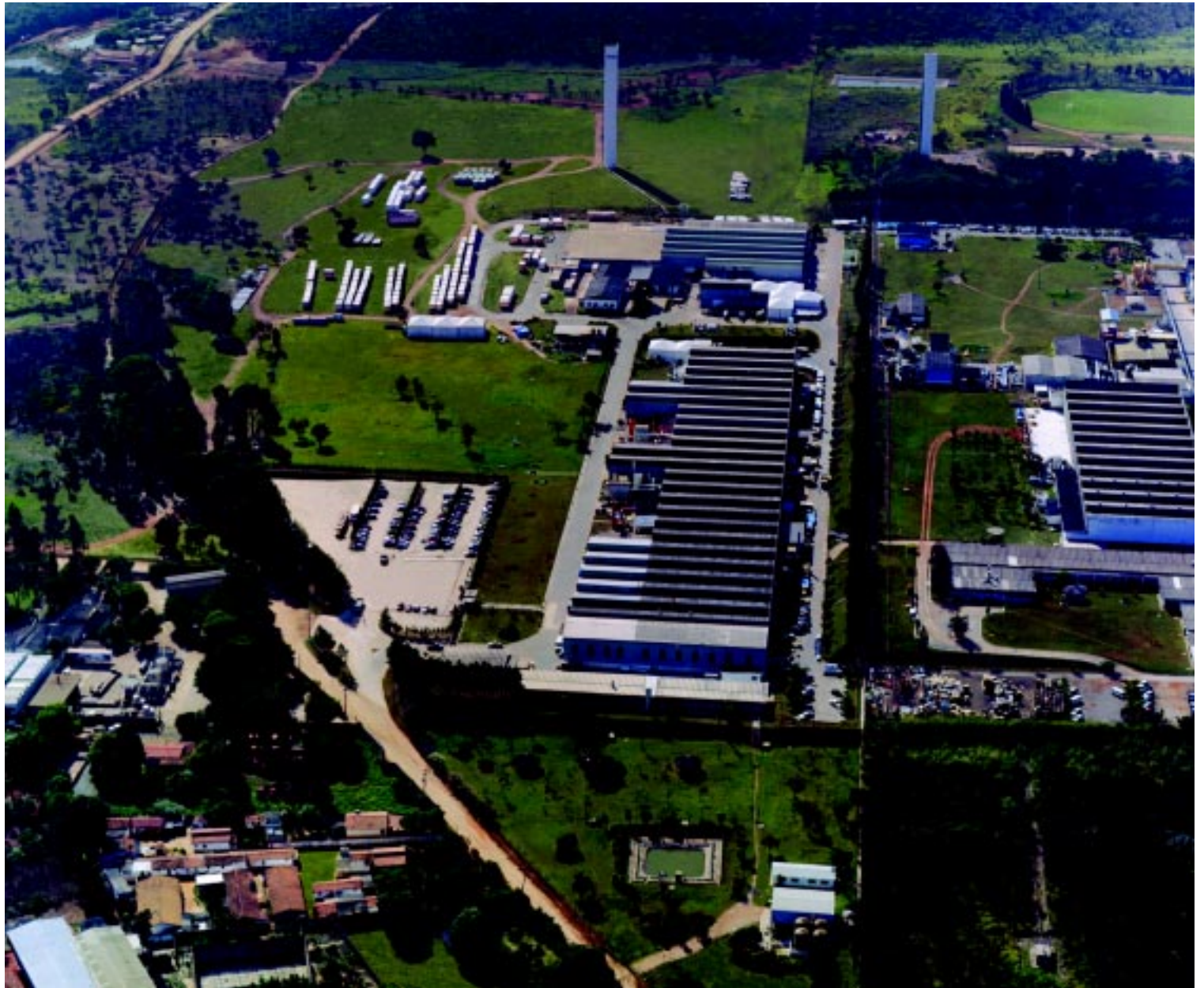
▲ Vista aérea da Fábrica de Sorocaba

Segundo ele, entre as vantagens deste tipo de bateria estão: menor tempo de recarga e menor temperatura da bateria durante o processo de recarga, o que aumenta a vida útil e reduz o fator de recarga (1,05 contra 1,20 das