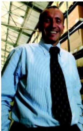
Chiellino: “queremos ser integrador de cadeia logística para dar ao cliente a solução inteira”

A TNT Logistics, empresa logística que opera exclusivamente por contrato, anunciou em dezembro último sua nova identidade corporativa e a mudança do nome para Ceva Logistics (Fone: 4072.6200).