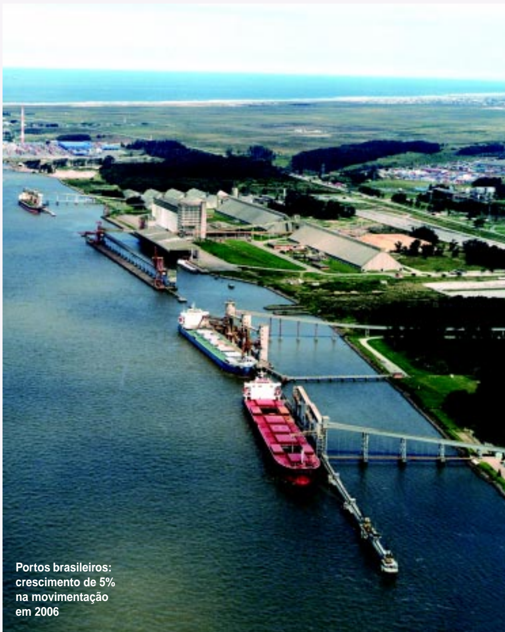
Portos brasileiros: crescimento de 5% na movimentação em 2006

“Para 2007, esperamos que a União mostre-se capaz não apenas de cobrar melhorias, mas também de promover oportunidades para que elas aconteçam, tanto nos portos do Paraná quanto nos demais portos brasileiros”, alfineta.