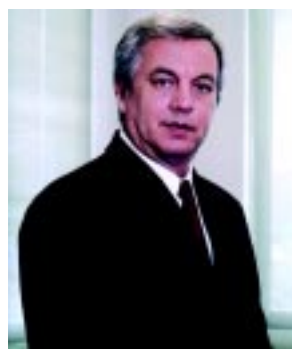
Wroblewski: “tivemos um ano favorável para o crescimento”

A unidade brasileira da Ryder cresceu em média 24% nos últimos seis anos e