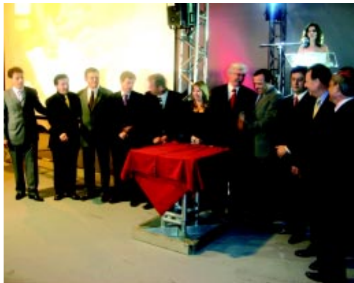
Diretores da nova empresa na solenidade de inauguração

Ajofer, Fantinati, Transpostes, Transvec e XV de Novembro, todas transportadoras rodoviária de cargas, uniram-se para formar a Mestra Log (Fone: 11 4358.7000), empresa especializada em logística e armazenagem, cujos projetos incluem just-in-time, cross docking, milk run e just-in-sequence, além de desenvolvimento de equipamentos especiais de movimentação e transporte e customização nos sistemas de informação aplicados a logística, entre outros.