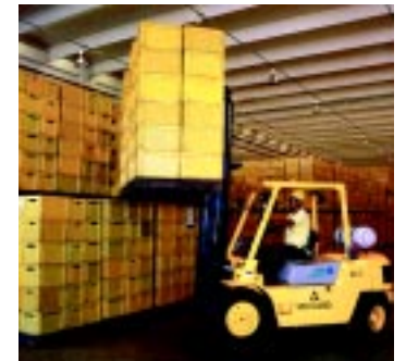
O incremento na armazenagem verticalizada depende do aumento do uso de equipamentos elétricos até 12 m de altura

dos aos equipamentos elétricos). Hoje, além de profissionais mais bem preparados, há a maior disponibilidade de equipamentos que promovem a correta aplicação. Sendo assim, os elétricos ganham mais espaço no mercado”, declara. ●