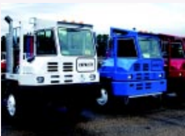
Movimentação de cargas dos terminais cresceu de forma exponencial

Por outro lado, a Equiport comercializa a linha de tratores de terminais tug masters Capacity com sete modelos de força de tiro diferentes para acoplamento de trailers para contêineres ou cargas em geral.