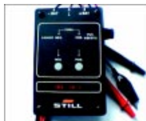
Equipamento usa a tensão da bateria que estará sendo analisada

Projetado pelo SZ-Laboratório e comercializado pela Still Brasil (Fone: 11 4066.8100), o IBI – Indicador de Baixas de Isolamento é um aparelho eletrônico compacto, portátil, sem baterias, destinado a identificar baixa de isolamento em baterias de 24, 48 ou 80 V, motores elétricos, equipamentos, chicotes, cabos e quaisquer dispositivos instalados em uma empilhadeira elétrica. Opera utilizando a própria tensão da bateria que estará sendo analisada, bem como todos os demais pontos da empilhadeira sob análise.