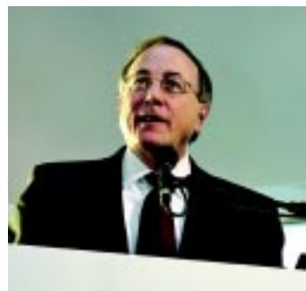
Kulik: o nome representa o teorema de Ceva, que é o ponto de união entre os lados de um triângulo

A respeito das dificuldades originadas pela troca da identidade, o diretor avalia que elas já passaram: “estamos saindo do pitstop”. Prova disto foi a geração de três importantes negócios