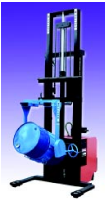
As duas empilhadeiras têm tendência de aumento de vendas, pois o uso depende diretamente do processo a ser empregado

leis ambientais ainda relaxadas”, considera.