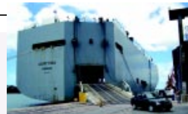
Incremento deveu-se à melhoria da capacidade gerencial

Já em relação à falta de rotas comerciais, o superintendente acredita que somente com a reunião de esforços é possível identificar novas oportunidades de negócios. “Administrações portuárias, exportadores, importadores, armadores, trabalhadores, enfim, toda a comunidade portuária unida tem condições de ampliar a presença de na-