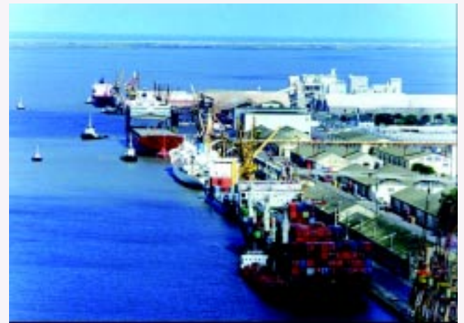
Ainda faltam investimentos em infra-estrutura e modernização

Considerando a aprovação destas ações, que são independentes das obras e serviços já programadas e com