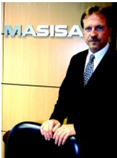
Hillmann: O CD beneficia clientes nos estados da região Sudeste do País, principalmente

A mais nova notícia divulgada pela Masisa (Fone: 41 3219.1850), fabricante de painéis de madeira, é o começo das operações do